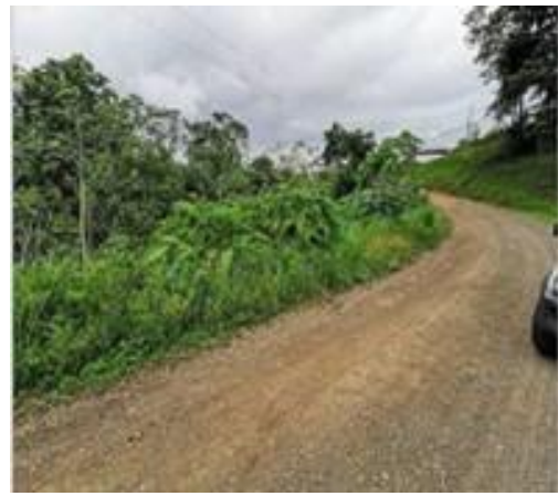
Tipo de vía de acceso rumbo norte