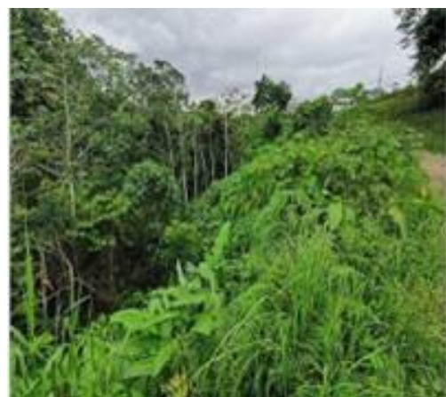
Topografía con respecto a calle pública