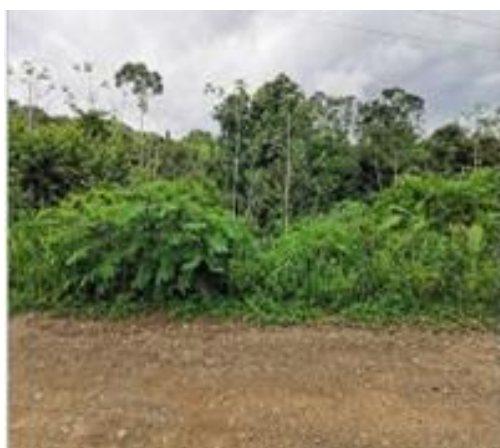
Frente a propiedad