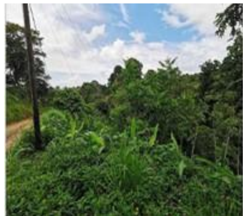
Lindero este frente a calle pública