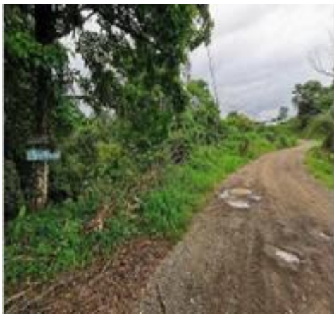
Tipo de vía de acceso rumbo sur