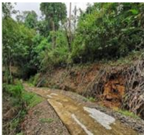
Topografía quebrada frente a servidumbre de paso